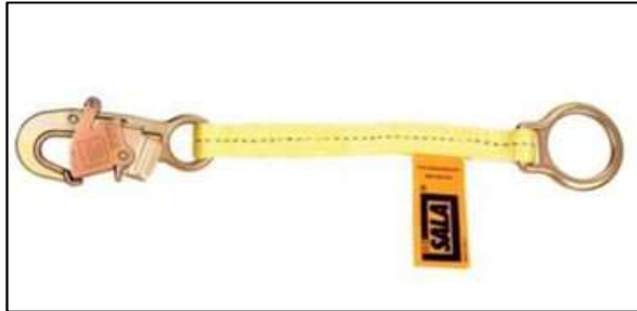
3M ID 70007438503/3M DBI-SALA® PN 1231117

La línea de productos de Protección contra Caídas de 3M ha recibido una serie de consultas respecto al uso de los extensores de anillo D dorsal con anticaídas autorretráctil (Self-Retracting Lanyard, SRL) de bordes frontales en entornos donde hay bordes filosos. A continuación presentamos dos ejemplos de extensores de anillo D dorsal de la línea 3M; pero el asunto abarca a todos los extensores de anillo D dorsal, independientemente de su distribuidor/fabricante: